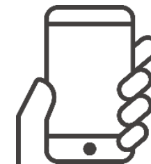
⑤SMSにより認証コードを通知 ※1