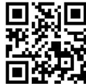
登録サイトのQRコード